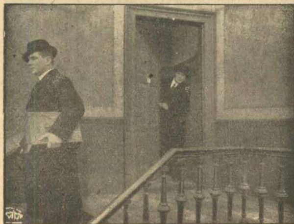
Det mystiske Hus.

Forbavset træder han et Skridt tilbage, thi foran ham aabner sig en Rigdom af Pengesedler og Smykker.