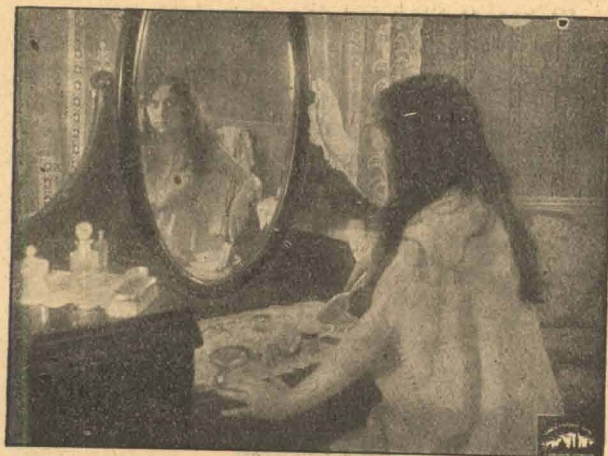
Amelie mærker Brandlugt.

Atter gribes Allen af en underlig Uhyggese-fornemmelse, men slaar sig dog til Taals med, at det er en eller anden, som vil staa hans Lykke i Vejen.