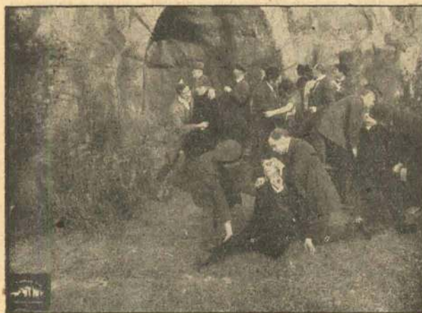
Den mærkelige Fremmede saaret.

I den mørke Postgade finder han det angivne Hus, som er en skummel og tilsyneladende ubeboet Bygning. Spejdende gaar han op ad Trappen og ender i en mørk, farvelig møbleret Stue.